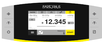
メインメニューボタン (画面左下)