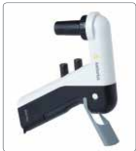
折り畳み式自立スタンド