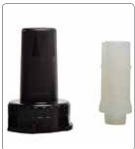
ノーズコーン、シリコンアダプター