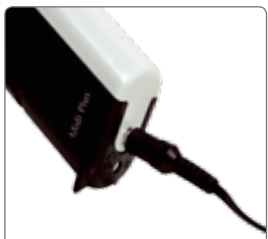
ACアダプターに接続している間、ピペティングが可能です