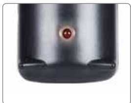
LED充電インジケーターは、バッテリーの充電レベルが低いときに点滅し始めます