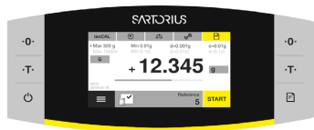
メインメニューボタン (画面左下)